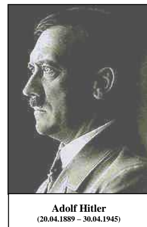
Adolf Hitler (20.04.1889 – 30.04.1945)

Leben: Adolf Hitler wurde am 20. April 1889 in Braunau (Oberösterreich) geboren. Zunächst arbeitete er als Gelegenheitsarbeiter, bis er schließlich im 1. Weltkrieg als Gefreiter für das deutsche Heer kämpfte. Im Jahr 1921 wurde er Vorsitzender der Nationalsozialistischen Deutschen Arbeiterpartei (NSDAP). Zwei Jahre später, 1923, kam es zu einem Putsch-Versuch, in welchem Hitler sich zum Reichskanzler ernannte 72 . Jedoch wurde dieser Putsch der NSDAP zerstreut, Adolf Hitler wurde verhaftet und zu einer Festungshaft verurteilt und die NSDAP wurde verboten. In der Zeit der Haft verfasste Adolf Hitler das Werk „Mein Kampf“, in welchem er seine ideologischen und politischen Gedanken niederschrieb. Nach der Haft Hitlers kam es zu einem Wiederaufbau der NSDAP. Durch die schlechte Wirtschaftslage im Deutschen Reich begünstigt, hatten Hitler und seine Partei